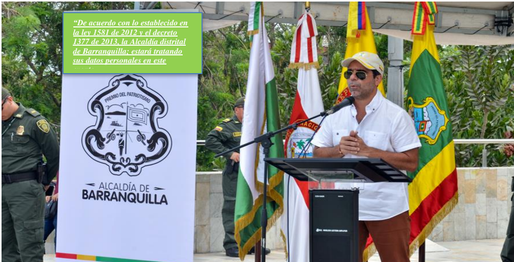
Ejemplo: Para diseño de pendón en eventos públicos

Y además antes de iniciar el evento se deberá enunciar o hacer lectura del siguiente texto: