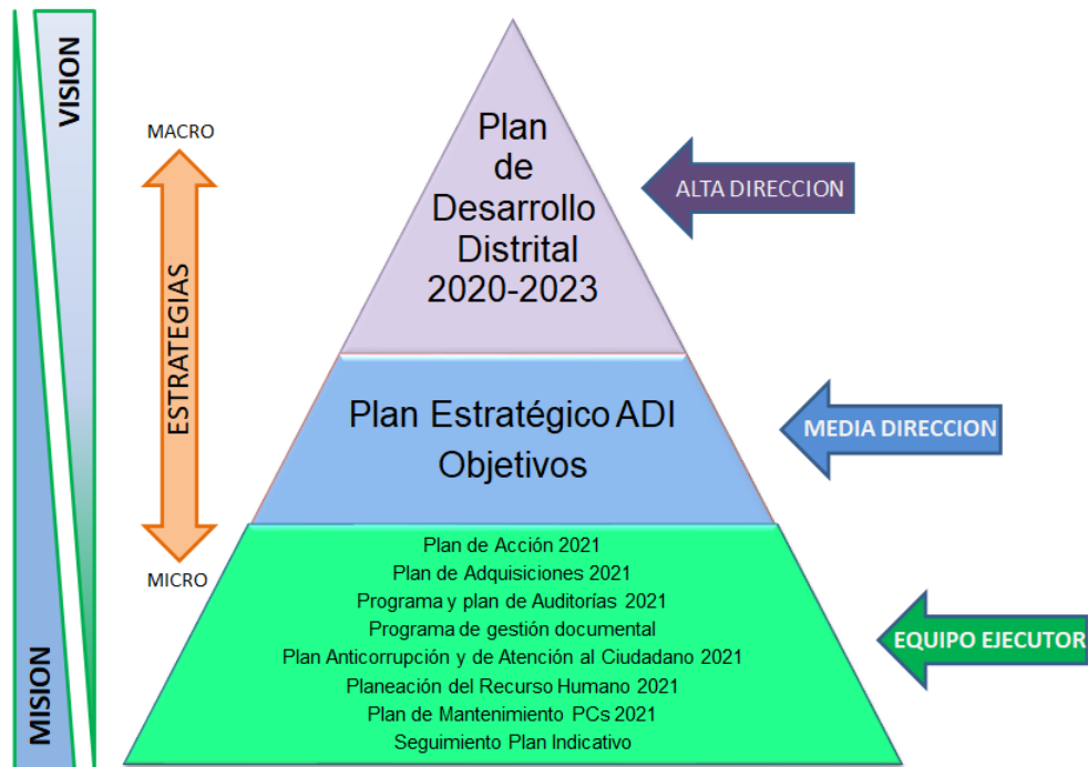
Tabla 1.3 Objetivos Estratégicos